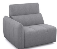
B150L (102 cm x 91 cm x 102 cm)