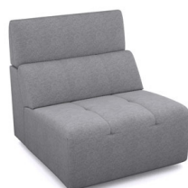
E150 (86 cm x 91 cm x 100 cm)