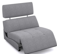
E150EL (86 cm x 91 cm x 100 cm)