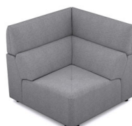
EK01 (100 cm x 91 cm x 100 cm)