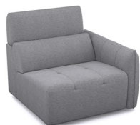
B150R (102 cm x 91 cm x 102 cm)