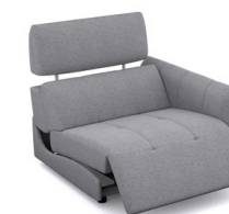
B150ER (102 cm x 91 cm x 102 cm)