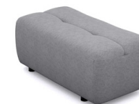
P010L/P010R (49 cm x 45 cm x 100 cm)