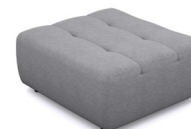
P000L/P000R (88 cm x 45 cm x 100 cm)