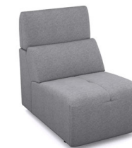
E100 (66 cm x 91 cm x 100 cm)