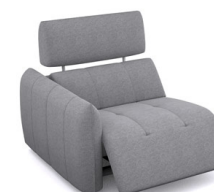
B150EL (102 cm x 91 cm x 102 cm)