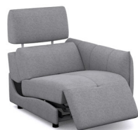
B100ER (81 cm x 91 cm x 102 cm)