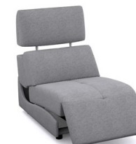
E100EL (66 cm x 91 cm x 100 cm)