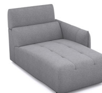
CH00R (100 cm x 91 cm x 160 cm)