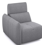
B100L (81 cm x 91 cm x 102 cm)